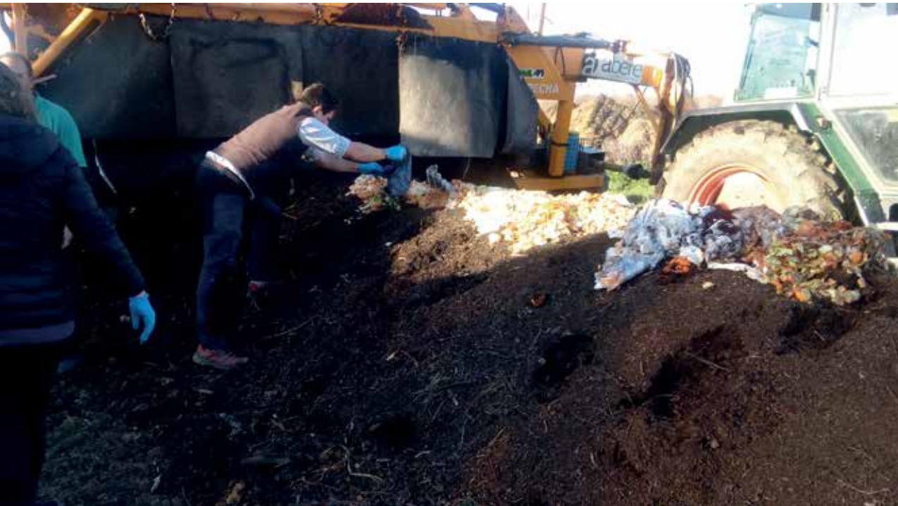
Argazkiak: Abere kooperatiba*

Arabako Foru Aldundiak jarri du ekimena martxan, Abere kooperatibaren laguntza teknikoarekin eta Zigoitiko Udalarekin, Gorbeia Eskolarekin eta Zaitegi Gaztandegiarekin lankidetzan. Gorbeialdeaz gain, esperientzia beste ustiategi batean ere ari dira garatzen: Done Bikendi Aranan, Kanpezu-Arabako Mendialdea Kuadrillan, hain zuzen ere