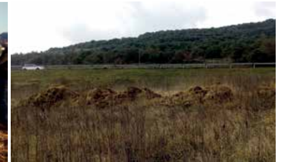
Iraulketara pila. Materiala pilatzen, nahastzen eta aldizka iraultzen duen sistema.