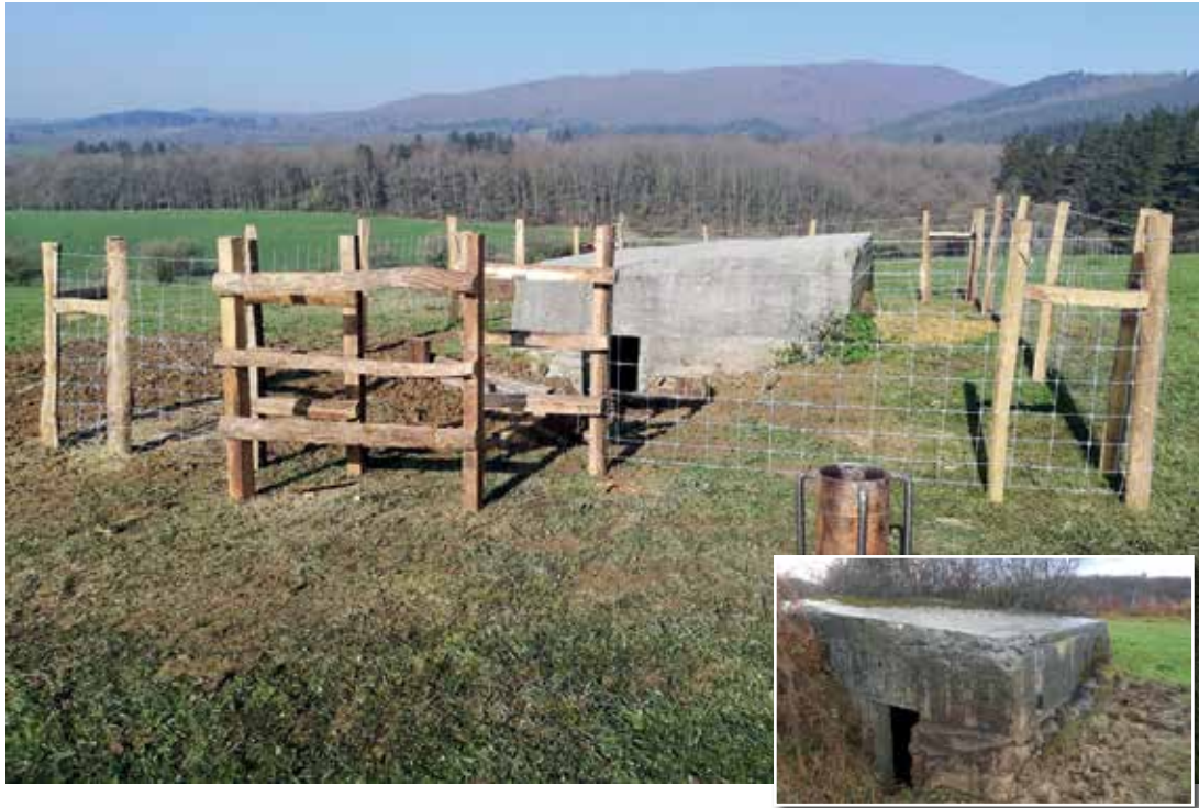
Testua eta argazkiak: Abadelaueta Etnografia Elkartea .

Abadelauetak Errepublikarren Frontetik antolatzen duen ibilbidearen zatia dira