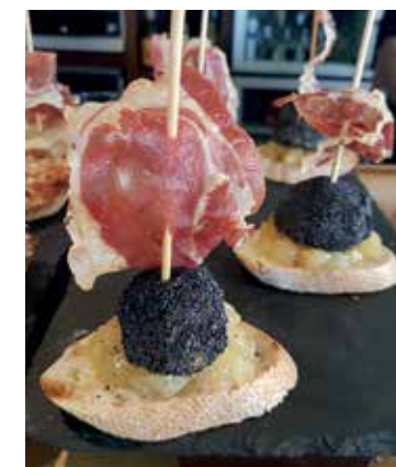
Artzegi taberna-jatetxeko pintxoak.